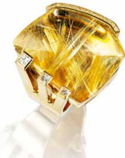
发晶戒指,主石重36.52克拉

在亚历山大看来，相对而言，传统珠宝商更易于倾向保守。然而，依旧有少数公司，愿意创新，遵循自然法则，而非保守的传统，以更加现代化、更富创造力的活力生存着。“这一小部分珠宝商，队伍