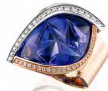
坦桑石戒指,主石重27.72克拉

头内部流动、反射的路线。近乎科学的观察和实验，是他工作的一个重要组成部分。斜面反光效果如何？增高台面会有怎样的影响？如果将裂纹雕刻成凸面的阴暗面会如何？怎样利用内含物，使得这块宝石成为独一无二的一块？一片叶子可以弯曲，宝石的腰棱可以弯曲吗？“在做这些的时候，这个‘玩’有着更高的目标：怎样才能突出宝石的自然之美？怎样才能展示残缺的美？怎样才能将他们与追求美的目标协调一致？最重要的是，我如何能创造和雕刻一件独一无二的宝石作品？”他如是阐述不走寻常路的亚历山大式宝石切磨之道。CC