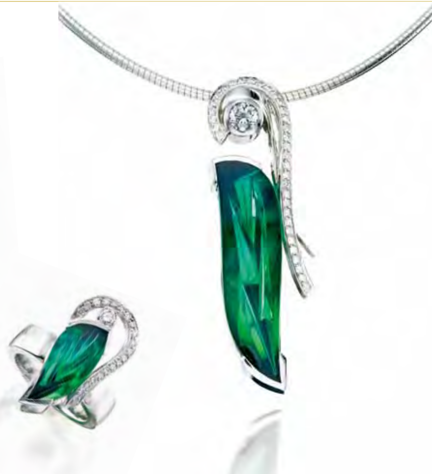
碧玺套饰,项链主石重29.44克拉,耳饰主石共重22.14克拉,戒指主石重5.09克拉

越来越壮大，已经在创新这条路上思考并付诸实践。他们今后肯定会成功，因为个性化需求正在扩大。”