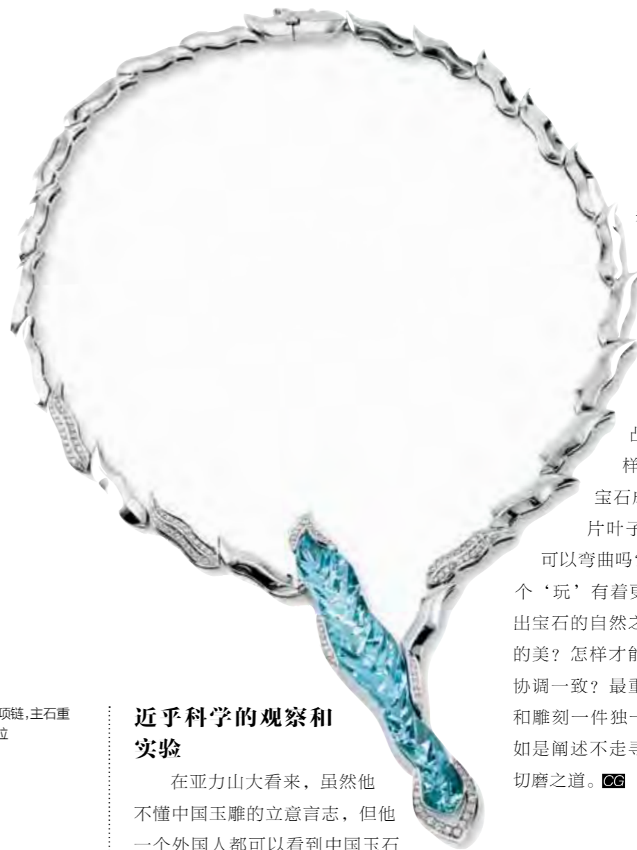
海蓝宝石项链,主石重30.08克拉