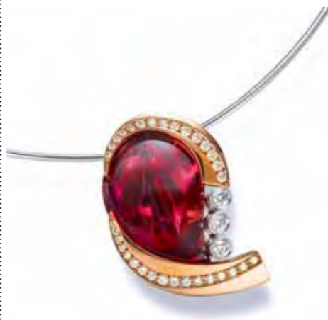
红碧玺吊坠,主石重15.61克拉

如他所言，力求完美，遵从自然美法则，是无论哪个国家的玉石雕刻师，都会遵循的艺术之道。