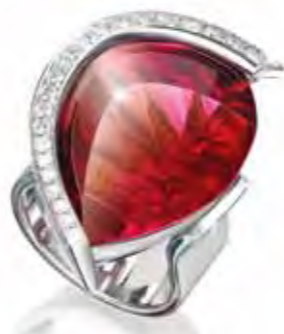
红碧玺戒指,主石重33.83克拉